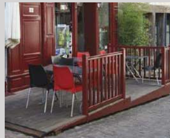
Ci-dessus : exemple de terrasse commerciale

- L'usage des matériaux plastiques (type PVC).