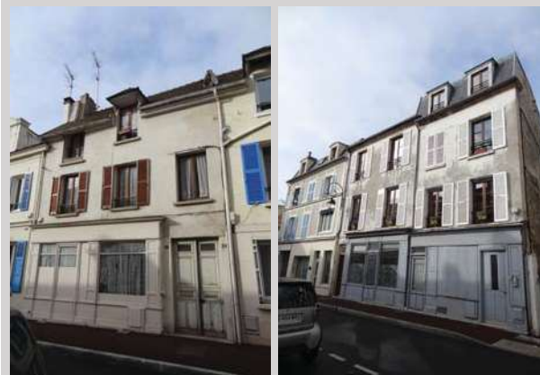
34 Grande Rue

Devantures anciennes repérées au document graphique réglementaire :